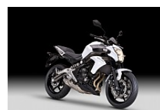
Pearl Stardust White