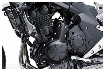
Kompakter, drehfreudiger Motor