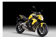
Pearl Shining Yellow

Trendigen Lifestyle im Einklang mit der persönlichen Leidenschaft erfahren und immer stilvoll ankommen. Mit der neuen ER-6n sind Fahrten in der City keine Pflicht, sondern ein stylisches Erlebnis.