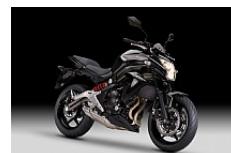
Metallic Spark Black